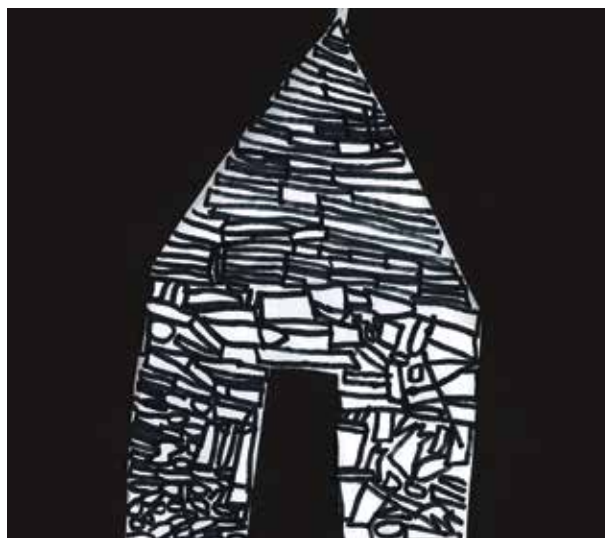
Noa Perhat, 3.b