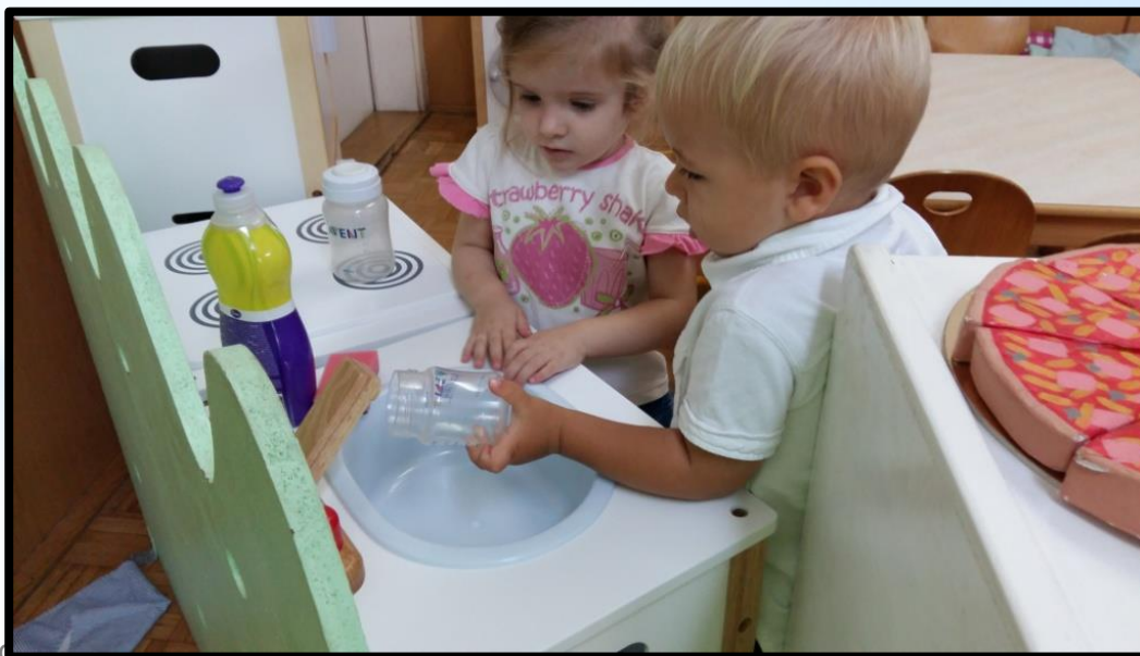
Samoinicirane i samoorganizirane aktivnosti djece