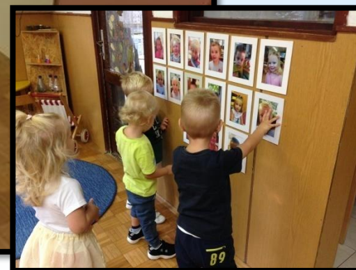
DRŽAVNI STRUČNI SKUP ZA ODGOJITELJE PREDŠKOLSKJE DJECE, Šibenik 15.-17.travnja 2019.