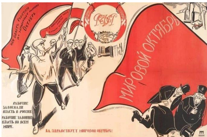
Poster Long live the world October! RSFSR. Moscow. 1920. Matorin M.V.

12.1. Koga prikazuju ljudi na lijevoj, a koga na desnoj strani postera?