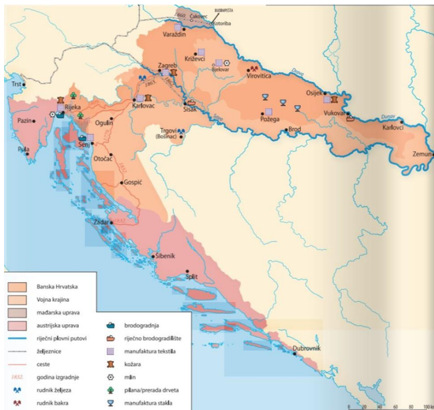
Zemljovid 2. Gospodarstvo na tlu Hrvatske u 19. stoljeću