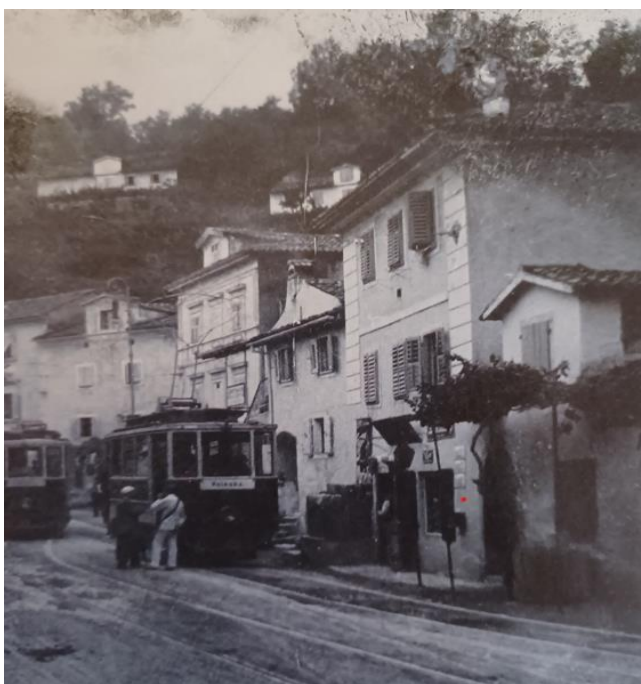
Fotografija 2. Tramvajska linija Matulji – Opatija – Lovran

10. Krajem 19. i početkom 20. stoljeća hrvatski su gradovi gospodarski napredovali te su se počeli širiti i urbanizirati. Kao posljedica toga, pojavila se potreba za uvođenjem novoga oblika javnoga prijevoza putnika te se počeo uspostavljati tramvajski prijevoz. Nakon prometovanja konjskom vučom, uvedeni su električni tramvaji.