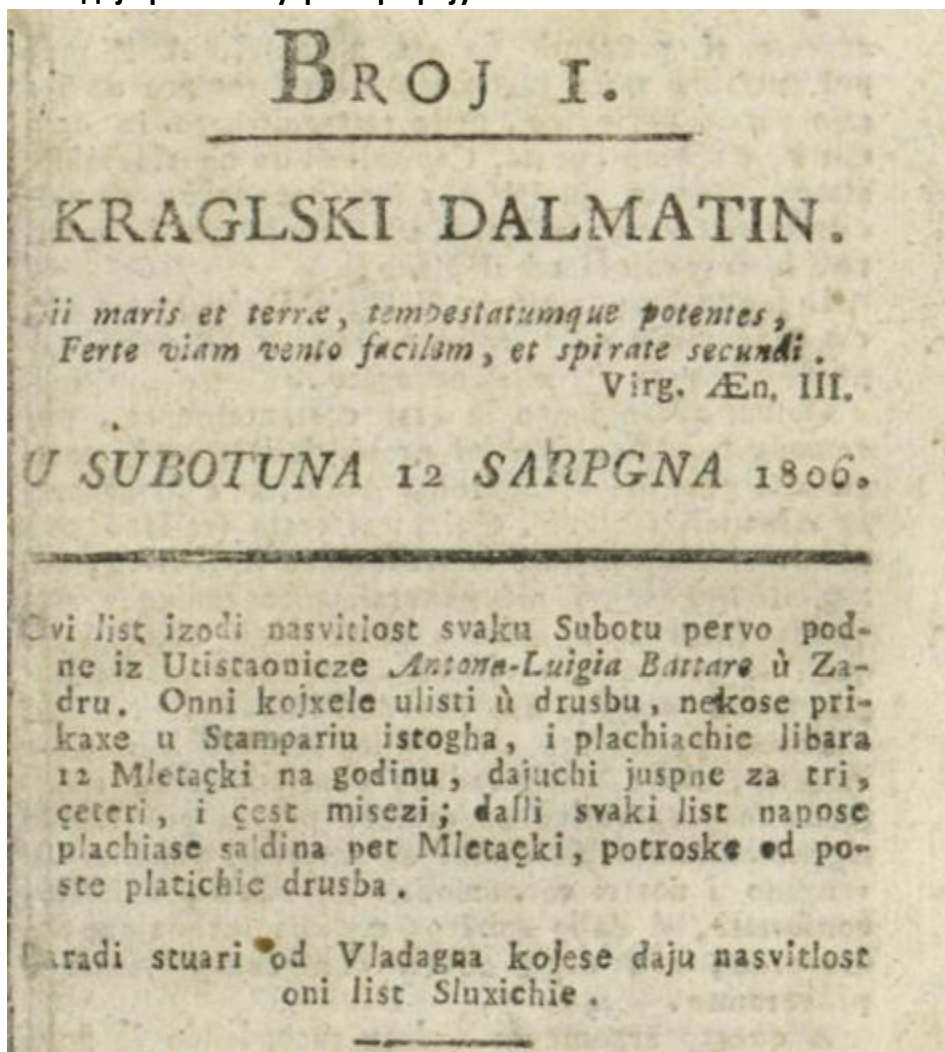
Фотографија 1. Краглски Далматин

Пажљиво погледај приложену фотографију 1.