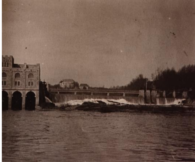
Фотографија 3. Хидроелектрана у Озљу 1909.

18. Најстарија континентална хидроелектрана у Хрватској изграђена је у Озљу и пуштена у рад 1908. Електрана је подигнута на природном водопаду реке Купе у центру Озља. У почетку је користила само за јавно осветљење, а после је помагала у развоју околне индустрије.