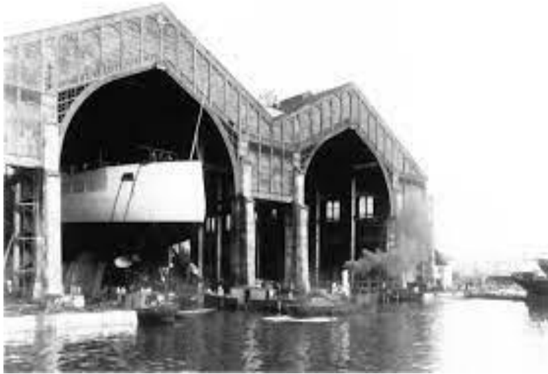
Фотографија 5. Арсенал у Пули

25. Скоро цео 19. век Истром је управљала Аустрија, због чега је Истра остала заостала и сиромашна покрајина. Одлучујући је био утицај бечке владе, која није показивала посебну бригу за напредовање тог подручја, које је првенство имало војно-политичку и стратешку важност.