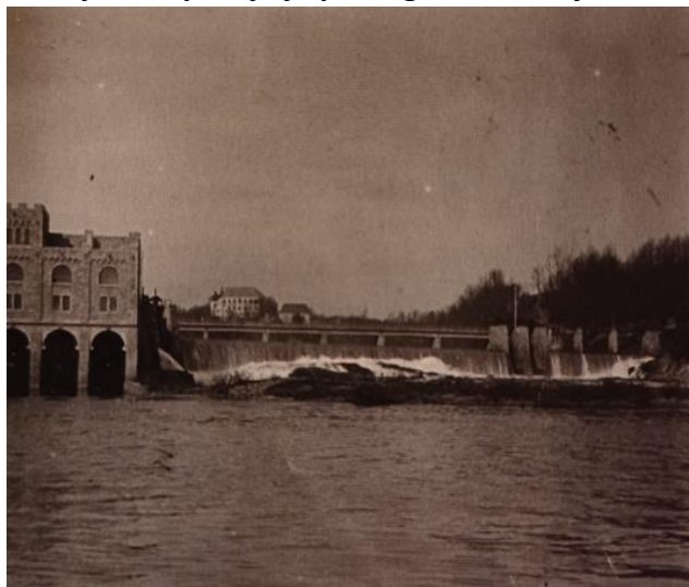
Fotografija 3. Hidroelektrana u Ozlju 1909.

18. Najstarija kontinentalna hidroelektrana u Hrvatskoj izgrađena je u Ozlju i puštena u rad 1908. Elektrana je podignuta na prirodnome slapu rijeke Kupe u centru Ozlja. U početku je služila samo za javnu rasvjetu, a poslije je pomagala u razvoju okolne industrije.