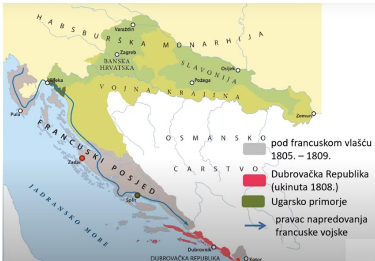
Zemljovid 1. Hrvatske zemlje tijekom Napoleonovih ratova (1805. – 1809.)