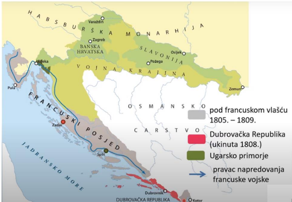
Карта 1. Хрватске земље у време Наполеонових ратова (1805 – 1809.)