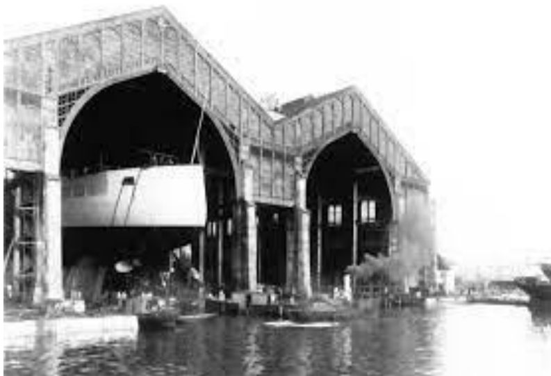
Fotografija 5. Arsenal u Puli

25. Gotovo čitavo 19. stoljeće Istrom je upravljala Austrija, zbog čega je Istra ostala zaostala i siromašna pokrajina. Odlučujući je bio utjecaj bečke vlade, koja nije pokazivala osobitu brigu za gospodarski napredak toga područja, koje je ponajprije imalo vojno-političku i stratešku važnost.