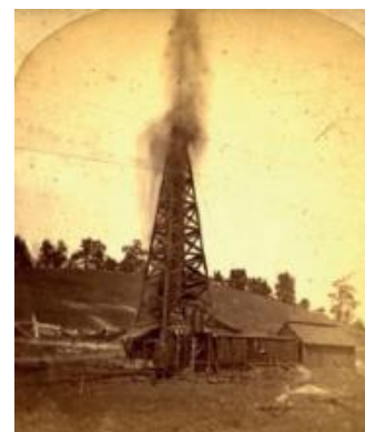
Fotografija 7.: Naftna bušotina

14. Primjena pogonske sile nafte izazvala je nove promjene u načinu proizvodnje. Naftne su bušotine od 1860. godine nadalje na raznim dijelovima svijeta počele crpiti važnu crnu tekućinu za pogon motora.