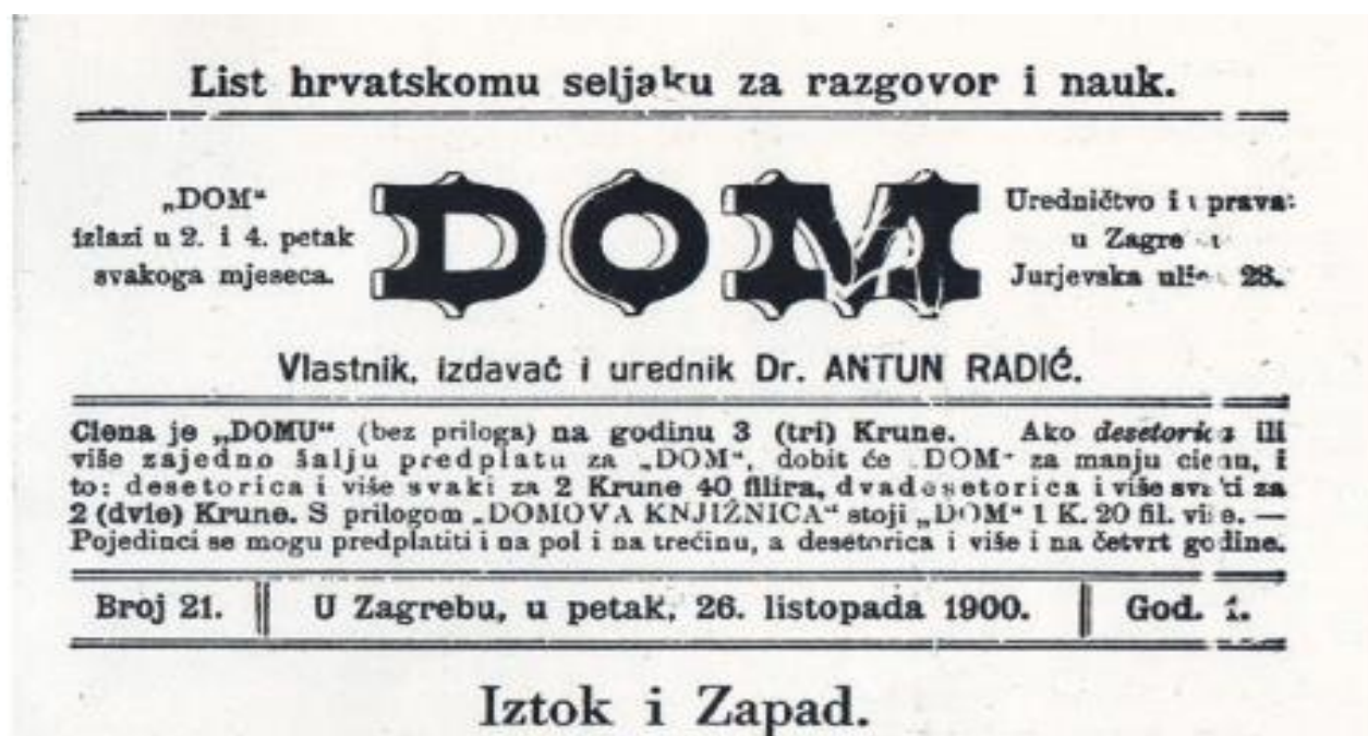
Slika 4.: Naslovnica časopisa Dom

21. Hrvatsko je seljaštvo do početka 20. stoljeća vrlo malo sudjelovalo u političkome životu. Antun Radić još potkraj 19. stoljeća pokrenuo je novine za seljaštvo Dom .