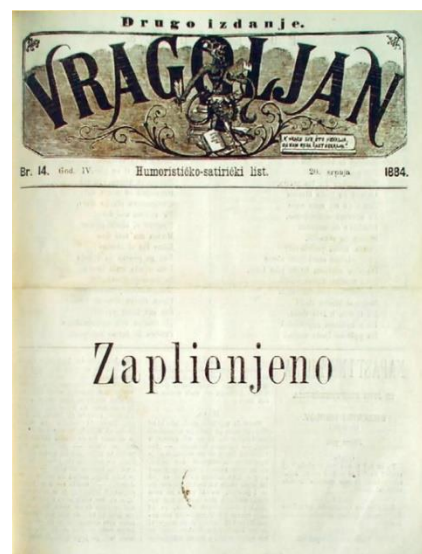
Fotografija 9.: Naslovnica satiričkog časopisa Vragoljan , 20. srpnja 1884. godine

23. Oporbeno djelovanje u vrijeme hrvatskoga bana Károlyja (Dragutina) Khuena-Héderváryja znatno su ograničavali unutarnji sukobi u političkim strankama koje su izdavale svoja oporbena glasila.