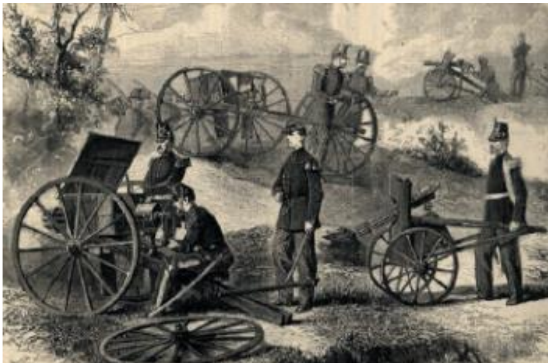
Grafika iz 1867. godine