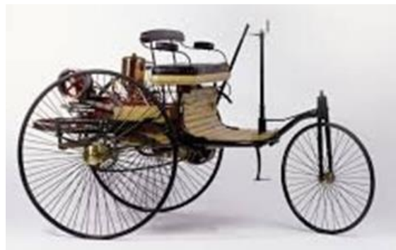
Fotografija 4.: Prvi automobil

12. Sredinom 19. stoljeća izumljeni su motori na unutarnje izgaranje u kojima sagorijevanje goriva započinje pokretanjem mehaničkih dijelova. Prvi su automobili kao pogonsko gorivo koristili paru i vodik.