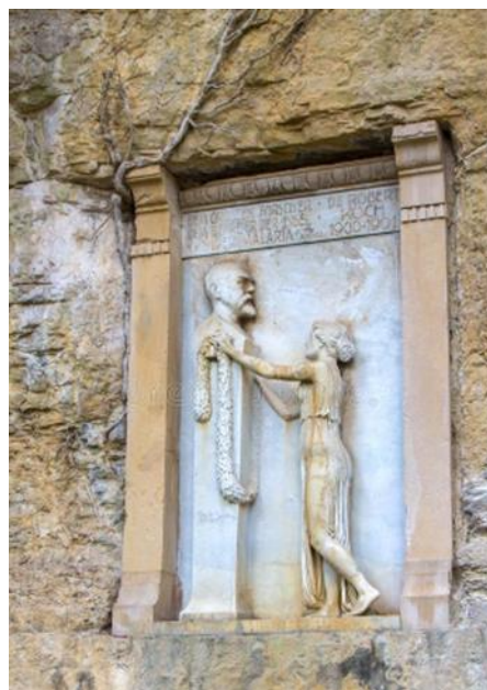
Fotografija 1.: Spomenik Robertu Kochu

1. Ljudski naponi u prošlosti bili su usmjereni na otkrivanje lijekova za pojedine bolesti. Za većinu bolesti ljudi nisu znali što ih uzrokuje ni kako se prenose. Napretkom medicine u 19. stoljeću smanjila se smrtnost i produžio životni vijek ljudi. Jedan od osnivača medicinske mikrobiologije Robert Koch revolucionarnim je otkrićima u samo dvije godine, 1882. i 1883., otkrio uzročnike dviju bolesti.