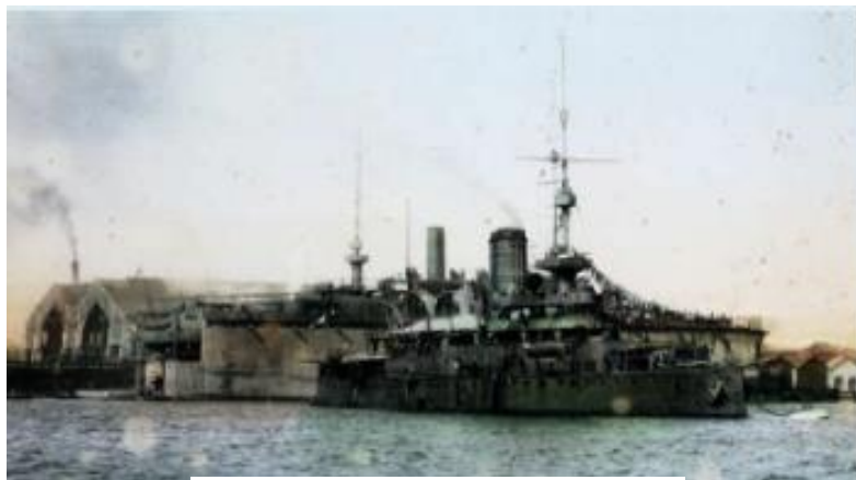
Fotografija 2.: Ratna luka

3. Austro-Ugarska Monarhija u dijelu je oružanih snaga imala carsku i kraljevsku ratnu mornaricu smještenu u nekoliko ratnih luka. U jednu od najljepših, najvećih, najsigurnijih i najdubljih luka koje postoje smjestila se najveća flota i glavna austrijska baza.