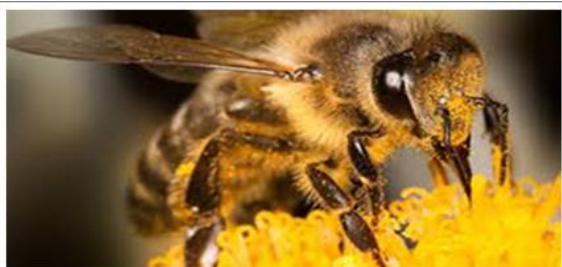
Globalna populacija insekata opada stopom do 2 posto godišnje.

Dok različite ljudske aktivnosti ubrzano mijenjaju naš planet, kukci se bore za preživljavanje, sa svime što o njima ovisi.