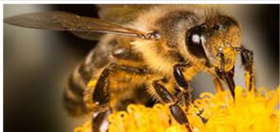
Globalna populacija insekata opada stopom do 2 posto godišnje.

Dok različite ljudske aktivnosti ubrzano mijenjaju naš planet, kukci se bore za preživljavanje, sa svime što o njima ovisi.