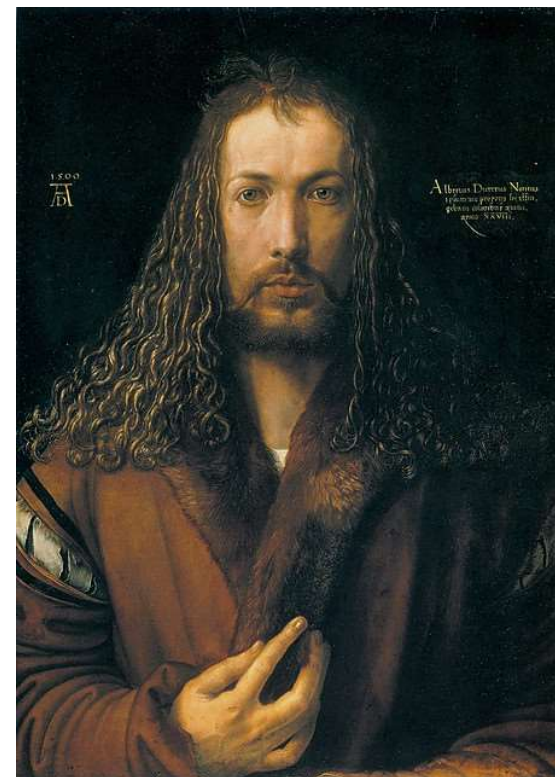
Albrecht Duerer, Autoportret