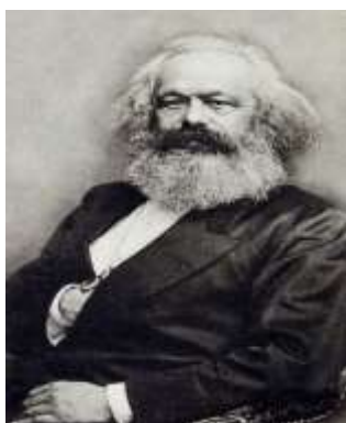
Slika 6. Karl Marx (1818. – 1883.)

Pažljivo promotri slike 6. i 7. i odgovori na pitanja.