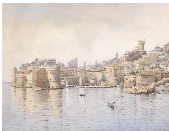
Slika 8. Dubrovnik u 19. stoljeću

Navedi ime europskog vladara koji je osvojio Dubrovnik. Upiši ime vladara na praznu crtu