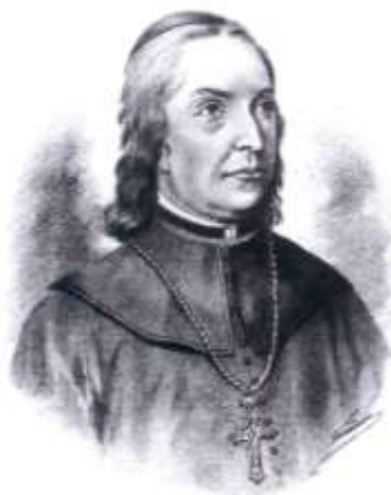
Slika 3. Portret istaknutog kulturnog djelatnika u Bansknoj Hrvatskoj

10. Početkom 19. stoljeća započeo je proces buđenje nacionalne svijesti brojnih europskih naroda. Slični su procesi zahvatili i narode u sastavu Habsburške Monarhije. Mnoge su se javne osobe na području Banske Hrvatske tada isticalle svojim radom na prosvjetno – kulturnom polju.