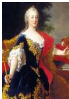
Slika 1. Martin van Maytens: Marija Terezija