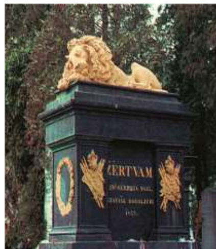
Fotografija 1. Spomenik na Mirogoju ( https://proleksis.lzmk.hr/46656/ )

19. Pažljivo promotri fotografiju 1. koja prikazuje jedan od najljepših i najstarijih povijesnih spomenika na groblju Mirogoj u Zagrebu. Uz koji pokret u 19. stoljeću je vezan spomenik i kome je posvećen?