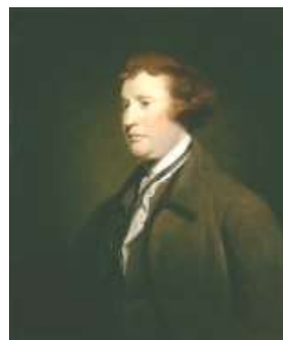
Slika 7. Edmund Burke (1729.-1797.)

14.1. Koje ideologije zastupaju osobe prikazane na slikama 6. i 7.?