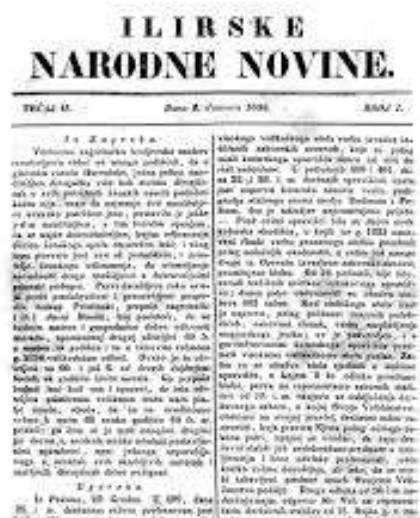
Slika 5. Naslovnica Ilirskih narodnih novina (Nsk, portal starih hrvatskih novina)

Pažljivo promotri sliku. Zaokruži slovo ispred triju točnih tvrdnji: