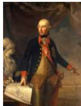
Slika 2. Georg Weikert: Josip II.

2.1. Navedi ime države na čijem su se prijestolju nalazile osobe na slikama.