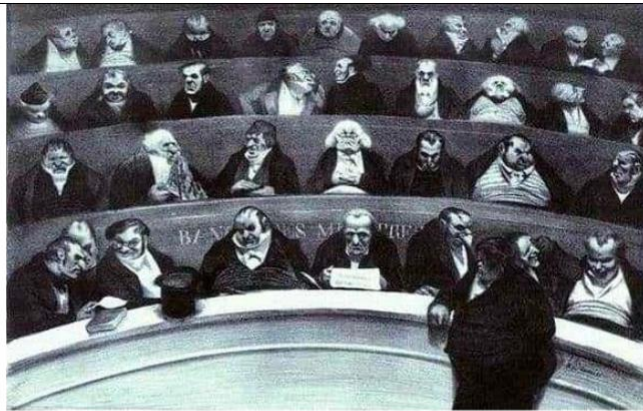
Slika 1. Honore Daumier: Zasjedanje francuskog parlamenta 1834. godine

Honore Daumier (Onor Dumie) francuski je umjetnik poznat pod nadimkom Michelangelo karikature. Kako je karikaturama kritizirao vlast i društvenu stvarnost zbog svojih je djela završio na odsluženju zatvorske kazne.