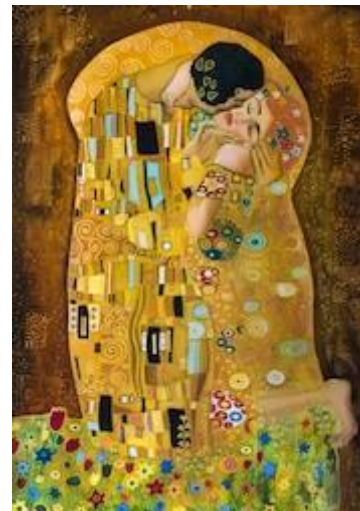
Slika 11. Gustav Klimt