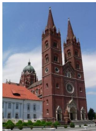
slika 2. Đakovačka katedrala sv. Petra, 1866. do 1882.