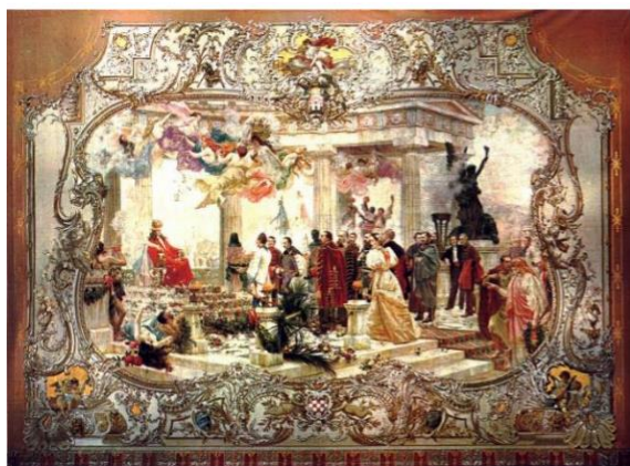
Slika 1. Vlaho Bukovac, Ilirski preporod, 1896.